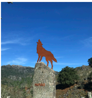
Estátua Lobo Ibérico