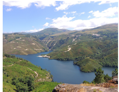
Albufeira de Salamonde