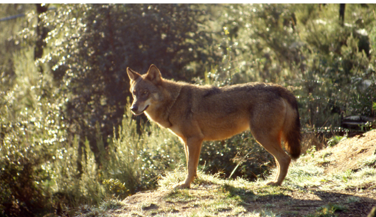
Lobo Ibérico ( Canis lupus signatus )