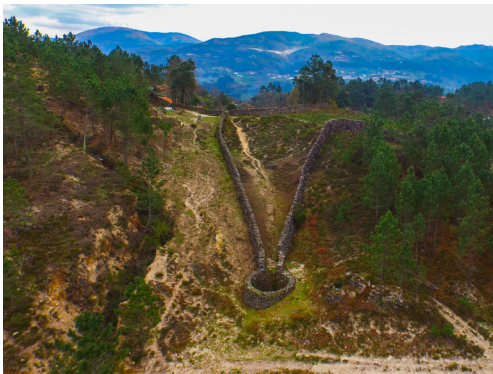
Vista geral do Fojo do Lobo