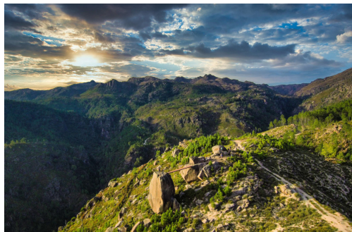
Miradouro de Fafião