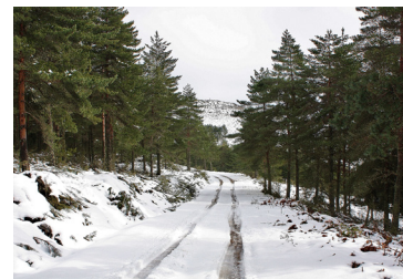
Ourigo com neve