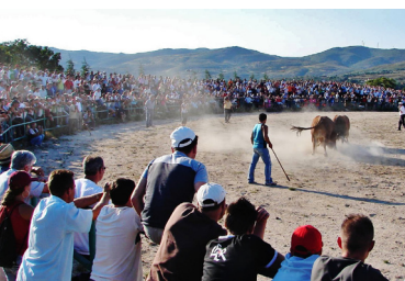
Chega de Bois