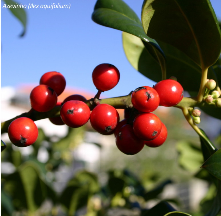
Azevinho ( Ilex aquifolium )

Aqui podemos encontrar aves florestais como o açor, o gavião e o pica-pau e mamíferos como o corço, o lobo, a gineta e o esquilo. Também existem grandes manchas de mato alto e rasteiro (giestas, tojos, queirós, urzes e carquejas), resultantes da degradação da floresta, devido ao fogo e ao aproveitamento da madeira, habitat de várias espécies de répteis (sardão e cobra-rateira), e algumas aves de rapina (águia-de-asa-redonda e águia-cobreira).