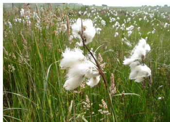
Bola de Algodão em Turfeira no Avelar

À saída da vila, é possível encontrar o granito de Montalegre, que é porfiróide, de grão grosseiro e médio. Embora tenha duas micas, biotite (negra) e moscovite (branca), predomina a primeira. Na aldeia de Castanheira, encontramos o granito da Vila da Ponte, semelhante ao granito de Montalegre, apresentando este grão médio. Ao passar em Cambeses do Rio, encontramos xistos pelíticos. Ao longo do percurso, podemos ver pegmatitos com quartzo, feldspatos, moscovite e turmalina. Durante todo o percurso, o xisto e o granito alternam frequentemente e é possível observar alguns contactos.