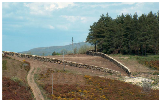
Fojo do Lobo no Avelar