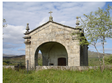
Capela de S. Lourenço