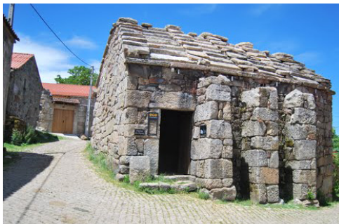
Forno Comunitário de Tourém