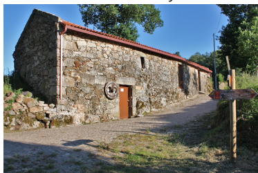
Pólo do Ecomuseu de Barroso